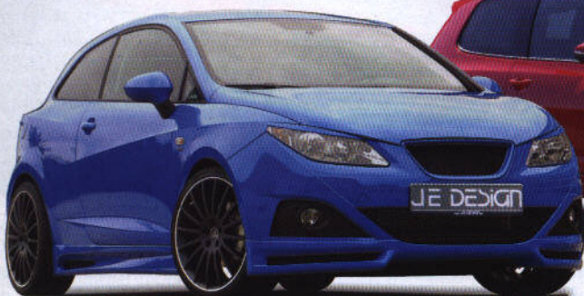
z.B. SEAT IBIZA 6J inkl. SC