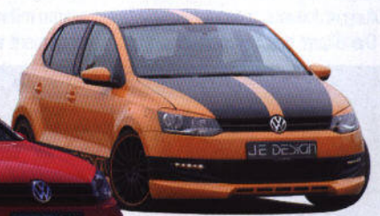
z.B. VW POLO 6R