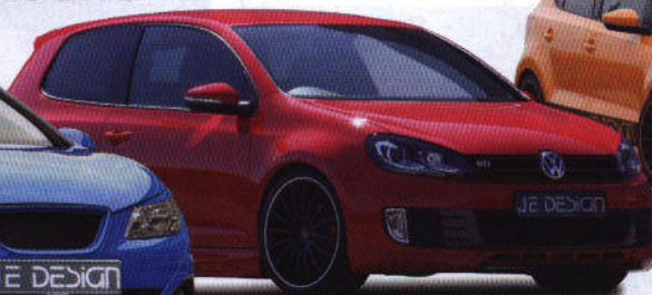
z.B. VW GOLF 6 inkl. GTD/GTI